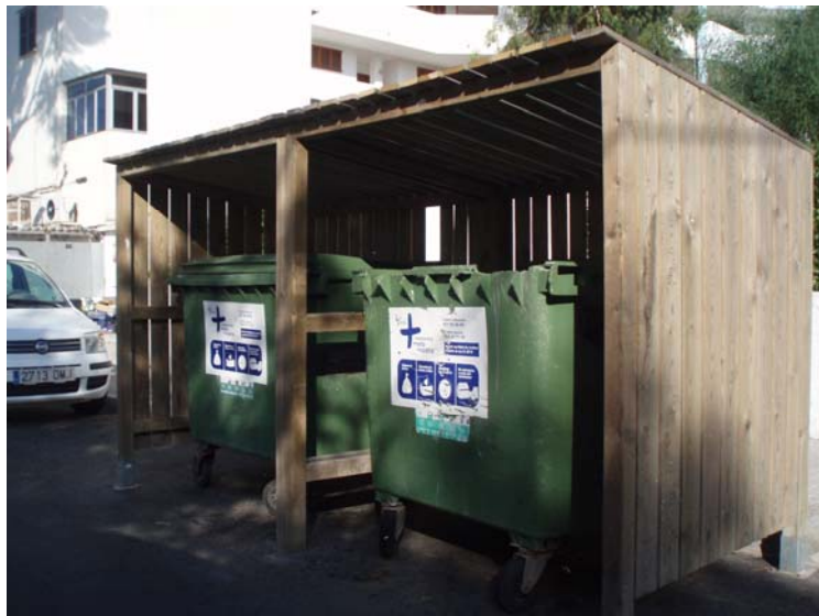
Contenedors (Cala Millor)