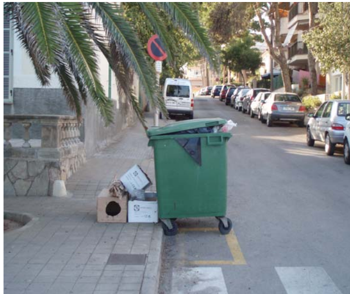
Contenedor ple (Cala Millor)