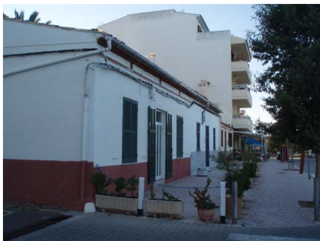
Cases de pescadors (Cala Bona)