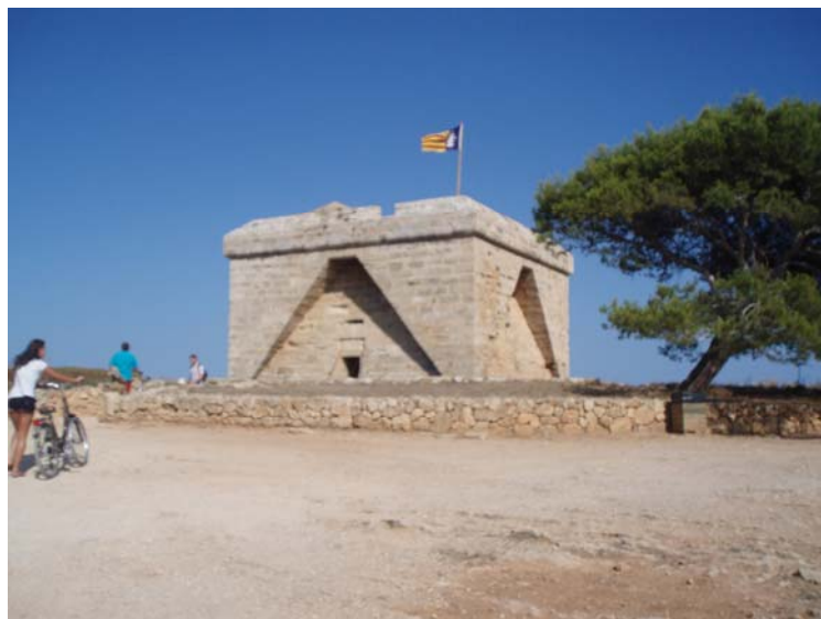
Castell (Punta de n'Amer)