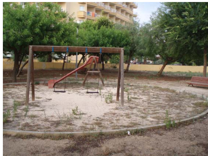
Parc infantil (Cala Bona)