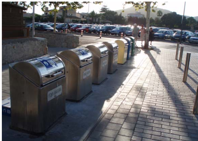
Contenedors de reciclatge (Cala Millor)