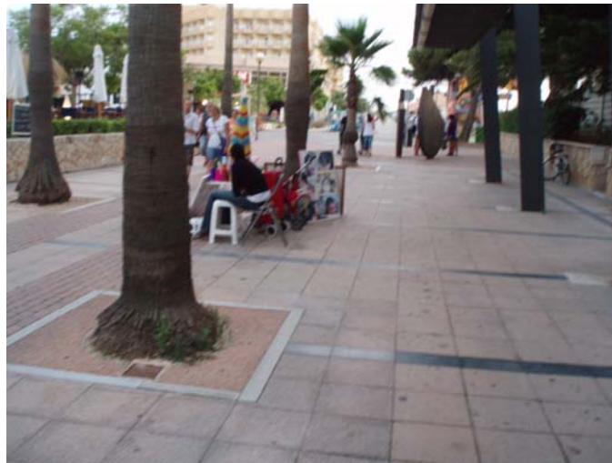
Passeig (Cala Millor)