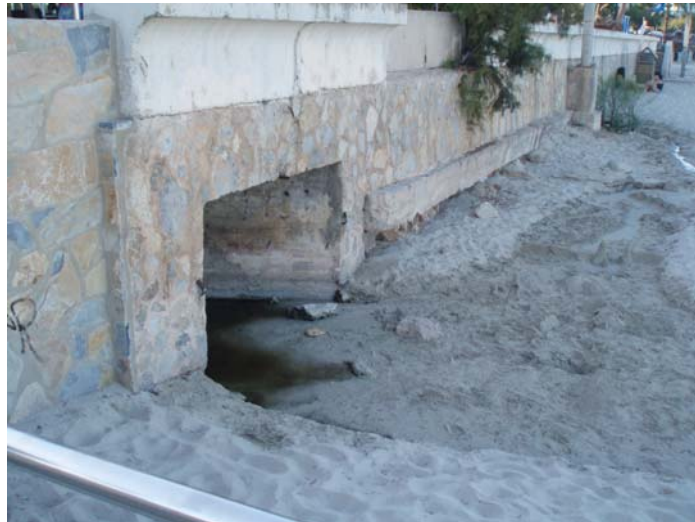
Desembocadura Torrent a la platja (Cala Millor)