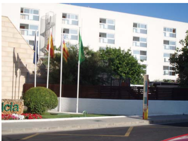
Aturada de bus (Cala Bona)