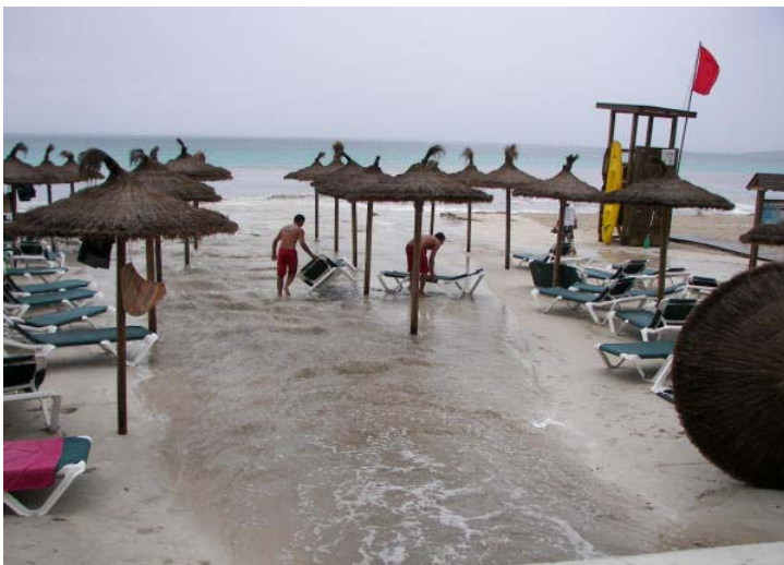
Platja de Cala Millor inundada (Diario de Mallorca)