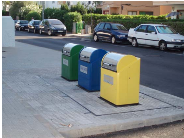
Contenidors reciclatge (Cala Bona)