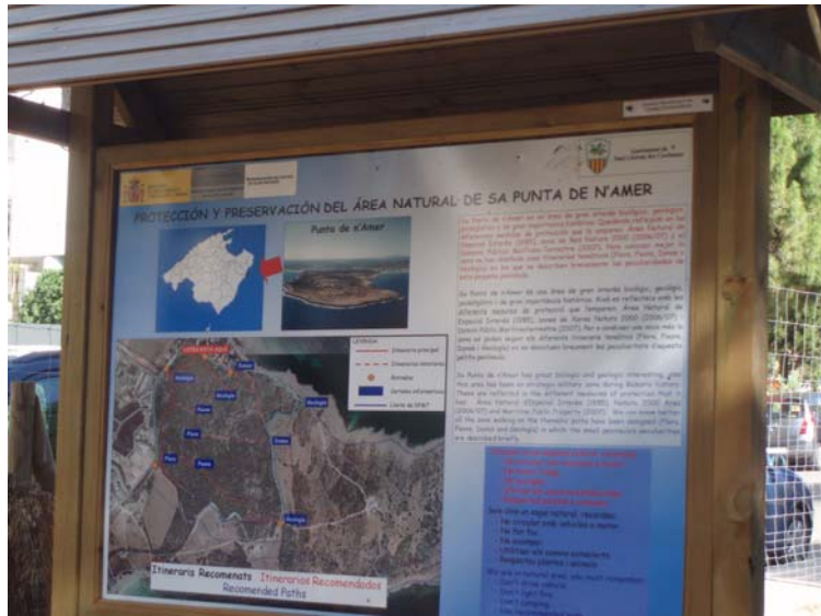
Cartell informatiu (Punta de n'Amer)