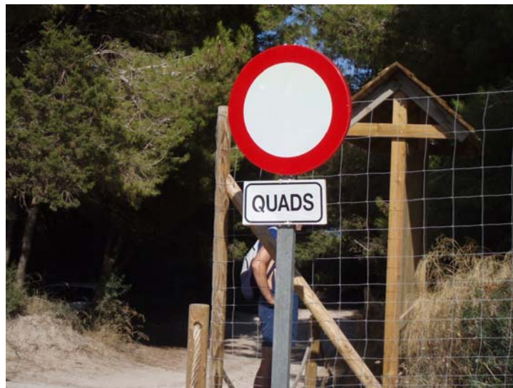
Senyal de prohibició (Punta de n'Amer)