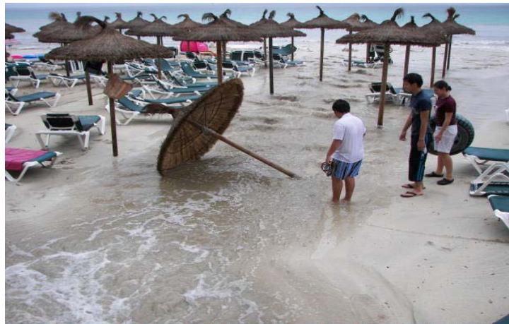
Desembocadura torrent a Cala Millor