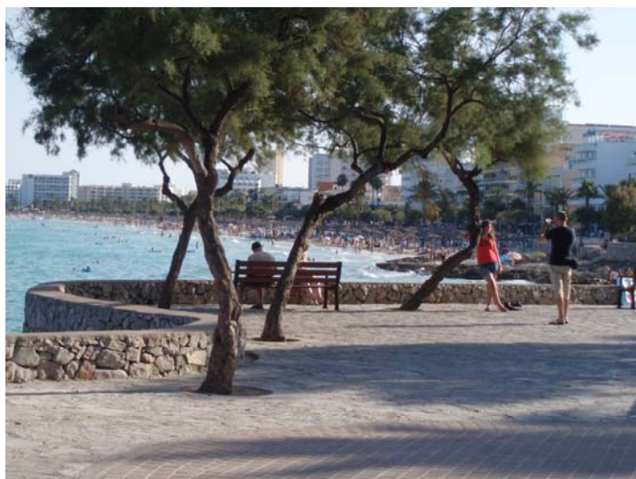
Passeig (Cala Millor)