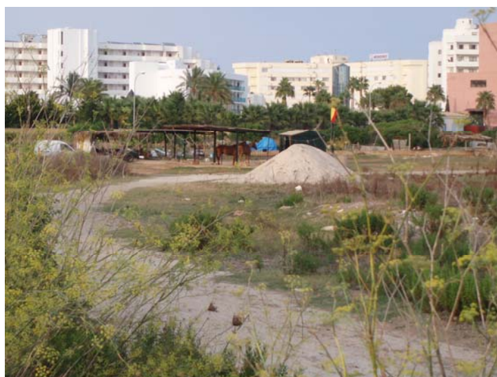
Solars abandonats (Cala Millor)