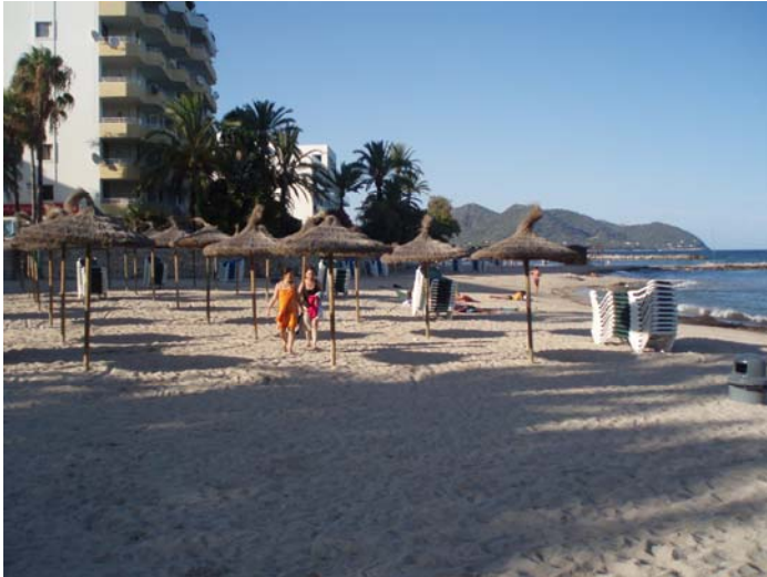
Platja (Cala Bona)