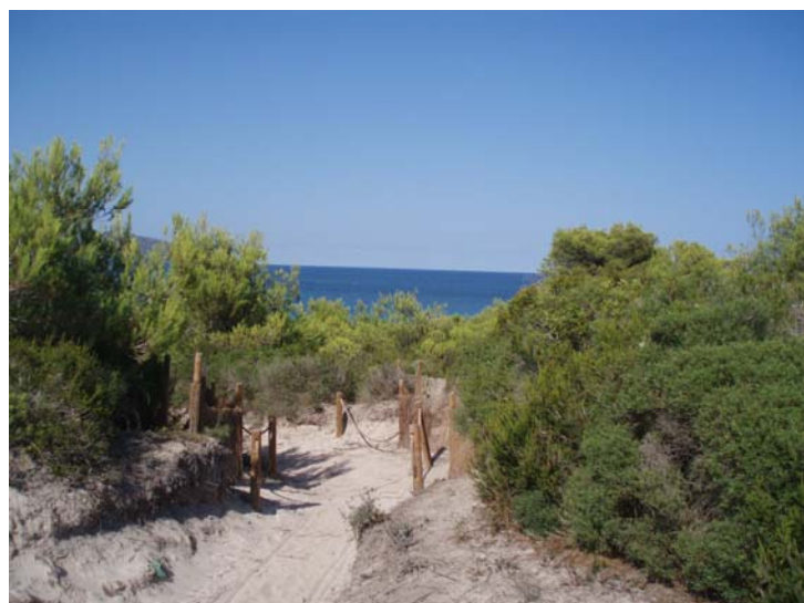
Paisatge dunar (Punta de n'Amer)