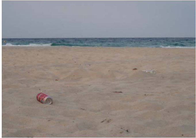
Brutor a la platja (Cala Millor)