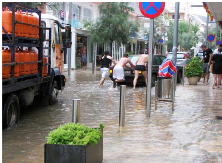
Carrer inundat a Cala Millor