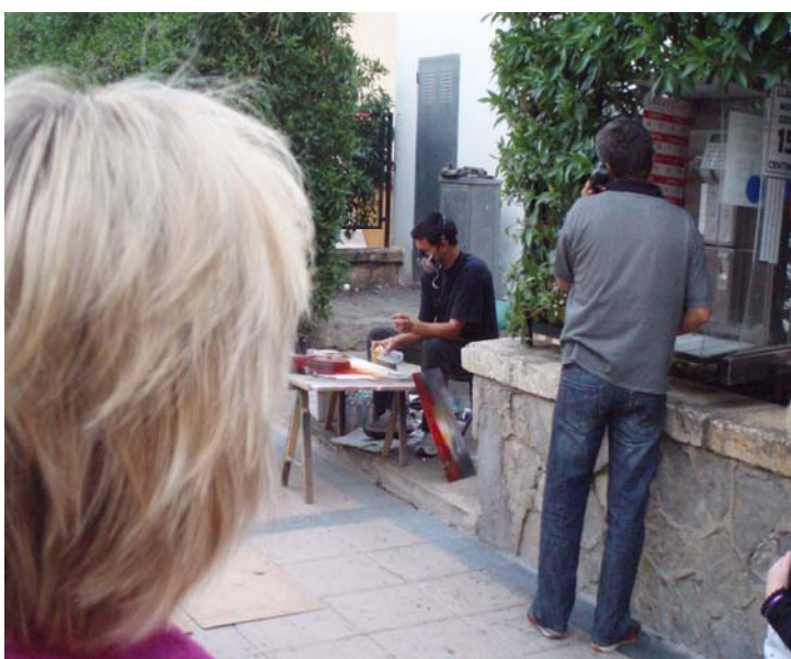
Pintor ambulat (Cala Millor)