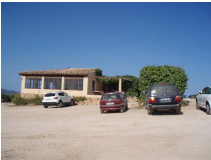
Bar Restaurant (Punta de n'Amer)