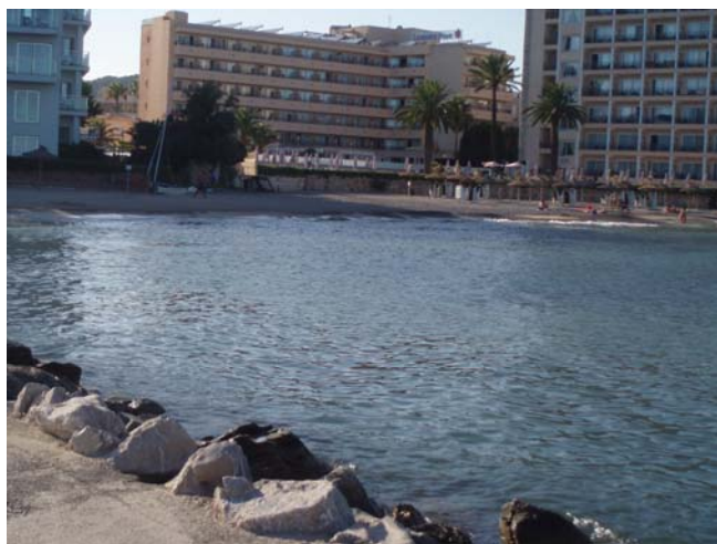
Dic i platja (Cala Bona)