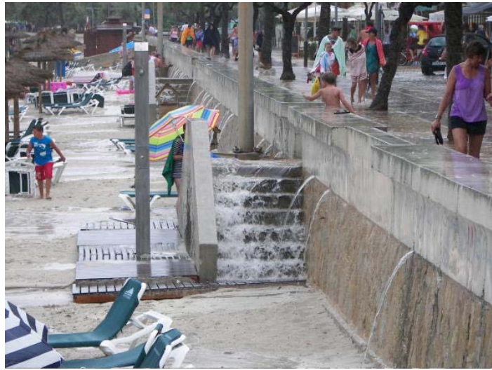
Torrentada a Cala Millor