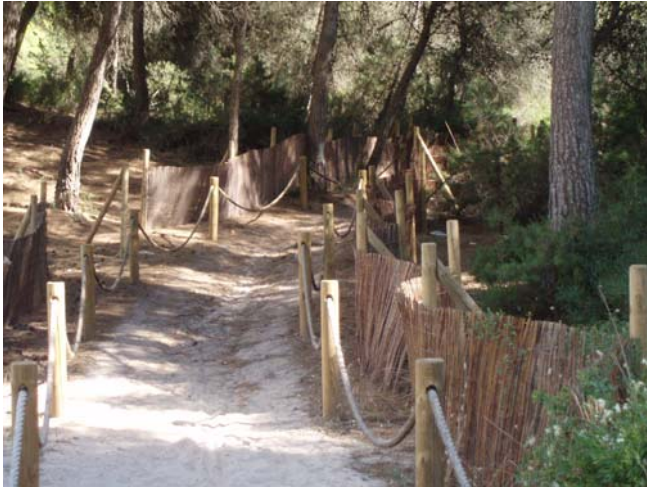
Camins (Punta de n'Amer)