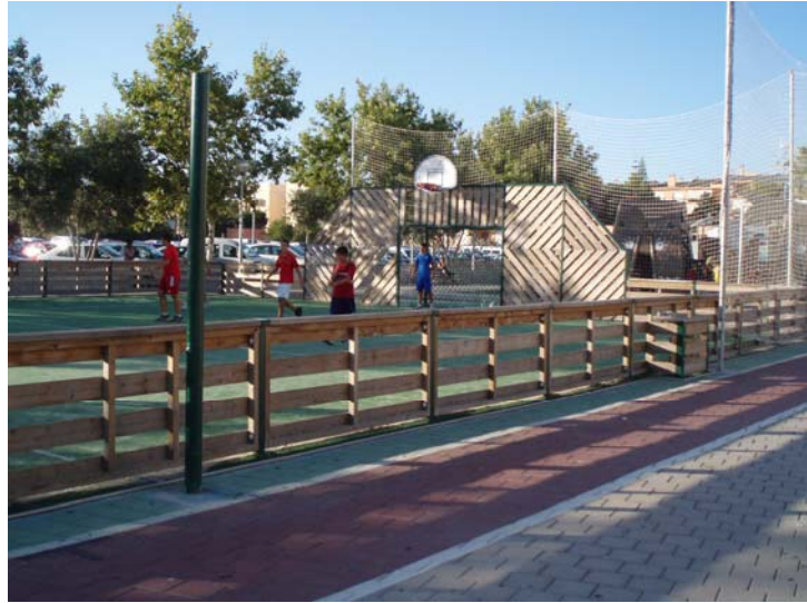
Parc públic (Cala Millor)