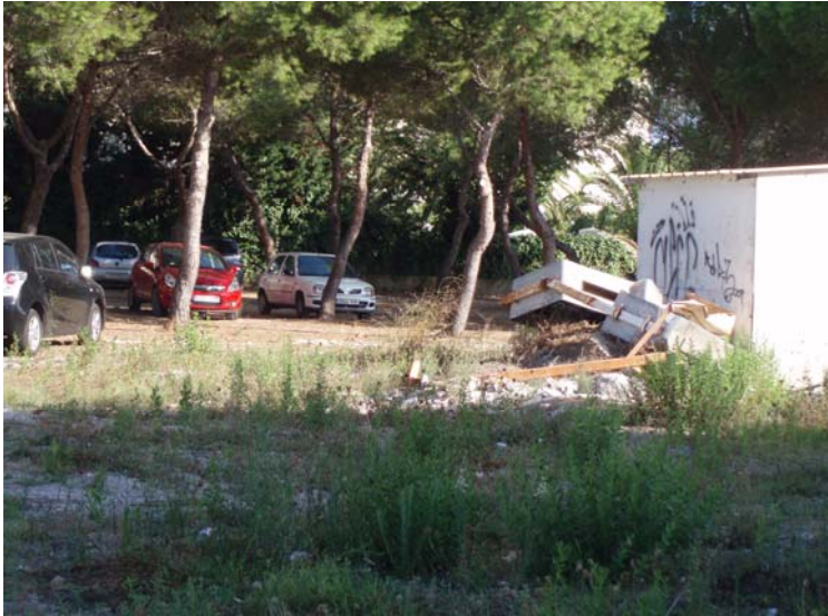
Aparcament il·legal (Cala Millor)