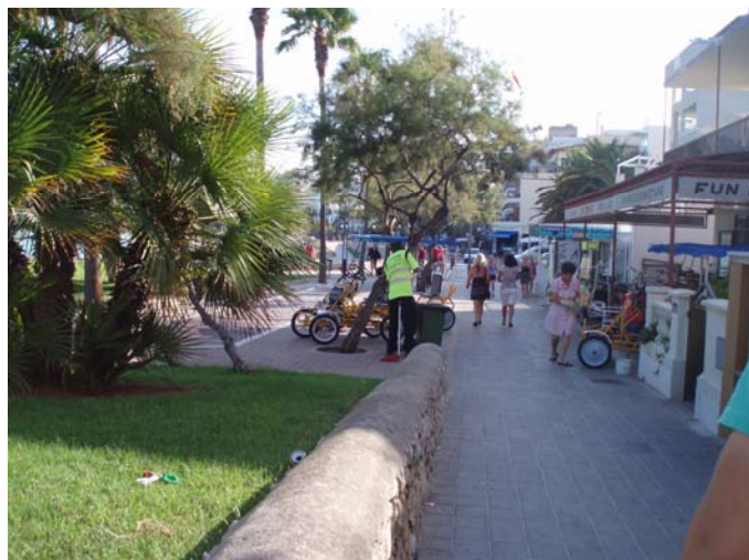
Personal de neteja (Cala Millor)