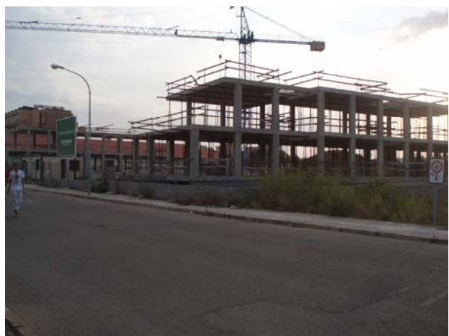
Edificis en construcció abandonats (Cala Millor)