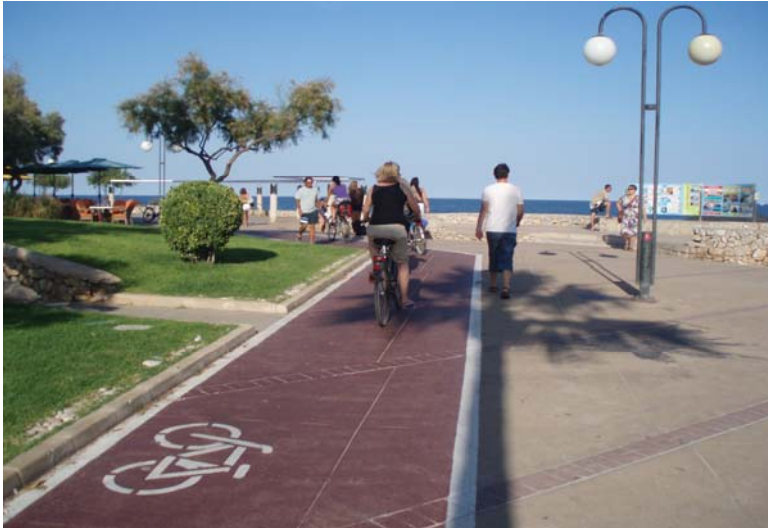
Carril bici (Cala Millor)