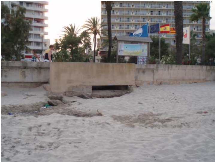
Desembocadura Torrent de Sant Llorenç (Cala Millor)