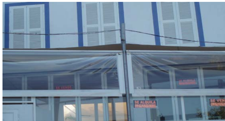
Restaurant tancat (Cala Bona)