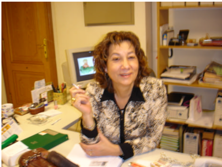
Voluntaria que ha trabajado con refugiados