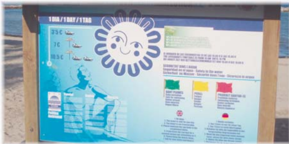
Font: "Avaluació del producte turístic de Cala Millor i Cala Bona". Estiu 2010