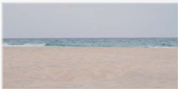
Font: "Avaluació del producte turístic de Cala Millor i Cala Bona". Estiu 2010