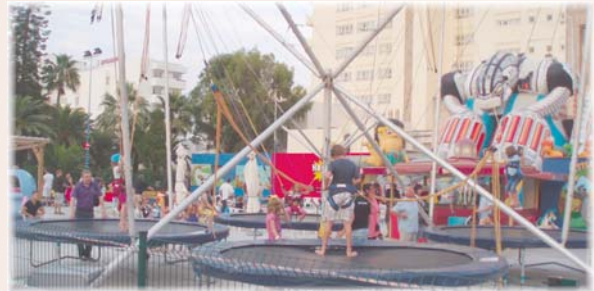
Font: "Avaluació del producte turístic de Cala Millor i Cala Bona". Estiu 2010

Com ja hem apuntat, una bona oferta complementària és bàsica per gaudir d'un producte turístic de qualitat i cobrir les expectatives de les persones que ens visiten.