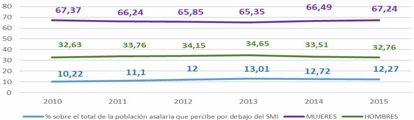
Población asalariada que percibe por debajo del SMI desagregada por sexo

Font: UGT. Departamento Confederal de la mujer trabajadora segons dades de les Encuestas de estructura salarial de l'INE